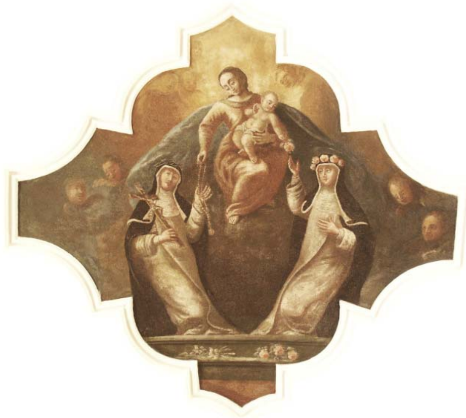
Sv. Kateřina Sienská, Panna Marie a sv. Růžena Limanská